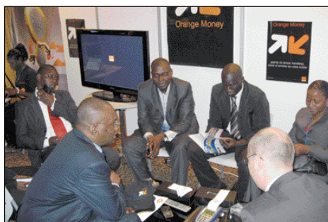
Rencontre du staff de Orange Money avec les partenaires de la BICIS

Le 3 mai dernier, Sonatel à travers les équipes Orange Money (du marketing et de la vente-animation) et toute la communauté de partenaires (banque, distributeurs) et de clients célébrait le 1 er anniversaire d'Orange Money. Lancé en 2010, Orange Money a véritablement révolutionné les instruments financiers à l'adresse des populations en leur permettant d'accéder grâce à n'importe quel terminal mobile par une interface simplifiée à toute une gamme de transactions allant du transfert d'argent au paiement de leur salaire en passant par le paiement de factures. Ce service Mobile Payments ou portefeuille électronique vise