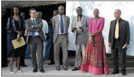
Lancement rseNews de Sonatel : les autorités

adresse e-mail dédiée pour les remontées et réactions ( rse-sonatel@orange-sonatel.com ). Clôturée par le ministre des transports terrestres, des transports ferroviaires et de l'aménagement du territoire, Mme Nafy DIOUF NGOM en présence des organisateurs, du