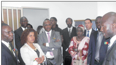
Inauguration du CTIC Dakar ; visite guidée des 1 ères entreprises incubées par les autorités et les partenaires

Cet incubateur regroupant en son sein le Gouvernement du Sénégal (SCA, ADIE, ARTP, Ministère en charge des TIC, Ministère des Finances, APIX, etc.), le secteur de l'Enseignement supérieur (UCAD, UGB), le secteur privé avec des organisations (l'Organisation des Professionnels des TIC, le CNES, le CNP, le MDES, la Chambre de Commerce, d'Industrie et d'Agriculture de Dakar, l'Association des Professionnels des Banques et Etablissements Financiers, etc.) et des entre-